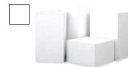
AR329 cm 50x50 H 50 AR330 cm 50x50 H 70 AR331 cm 50x50 H 100 € 54,00