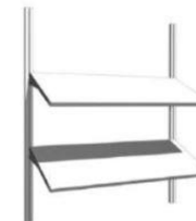
AR161 Mensola 100x30 su cremagliera € 37,00