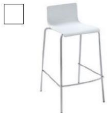
AR846 Sgabello bianco € 36,00