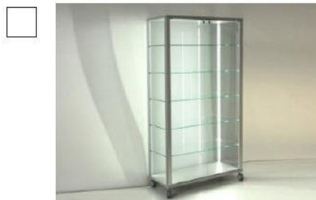
AS053 Vetrina cm 102x45 H cm 183 € 288,00