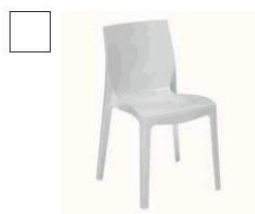
AR787 Sedia bianca € 35,00