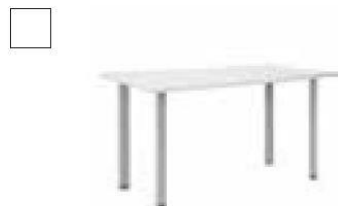
AR659 Scrivania Bianca 140x70 H cm 70 € 70,00