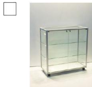
AS054 Vetrina cm 98x42 H cm 112 € 220,00