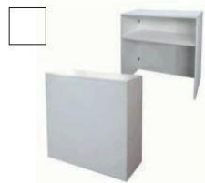
AR629 Banco reception € 114,00