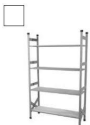
AR718 Scaffale per ripostiglio 100x42 H cm 170 € 50,00